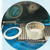
部品を解体し、つけ置きしてから洗浄を始めます。