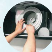
吸引ドラムのガンコな汚れを落とした後、部品を取り付けます。