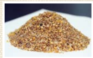
日齢にあわせて飼料を与えます

鶏には抗生物質、抗菌剤を含まないオリジナルの飼料を与えています。衛生的な鶏舎で健康的に育った鶏の肉質は、安全面での評価だけでなく「おいしい」と評判です。