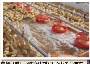
農場は厳しい防疫体制がしかれています

マルイ農協の生産者たちは、「安全・安心」のためにプライドを持って鶏を生産しています。それは、まるで赤ちゃんを育てるような気持ちで、朝早くから夜遅くまで大切に育てています。