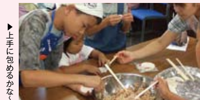
▶上にも包めるかな?

子どもたちに、自ら料理をつくりあげる達成感や食べ物の大切さなどを知ってもらうと「子どもクッキング」を行っています。