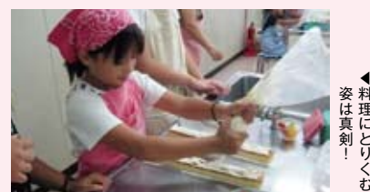
◀料理にとりくむ姿は真剣!