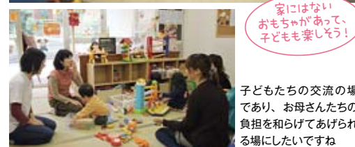
家にはないおもちゃがあって、子どもも楽しそう!

また、子育て経験のあるスタッフ2人が常駐し、子どもの遊び相手からママたちの話し相手まで務めています。子育ての楽しさや心配事、悩み、失敗談など、毎日の生活で遭遇するさまざまな出来事を、ゆつくりとしゃべっていきませんか?