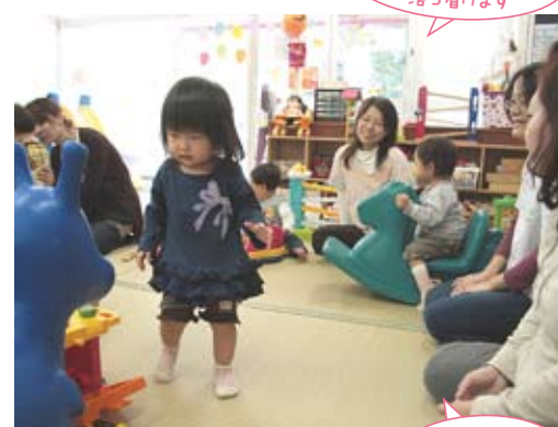
友人宅にお邪魔しているみたいで、落ち着きます

位置する加賀田中学校区は、古くからの住宅地と新しいファミリー向けマンションが隣接し、幅広い年代層が共存する街。利用者の多くが、就学前の子どもとママ。子どもの年齢が近いこともあって、初対面同士でもママたちは打ちとけた雰囲気。