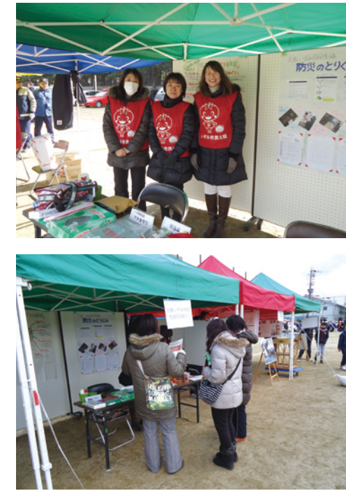
*いづみ市民生協は、24の市町村と「防災協定」等を締結しています。