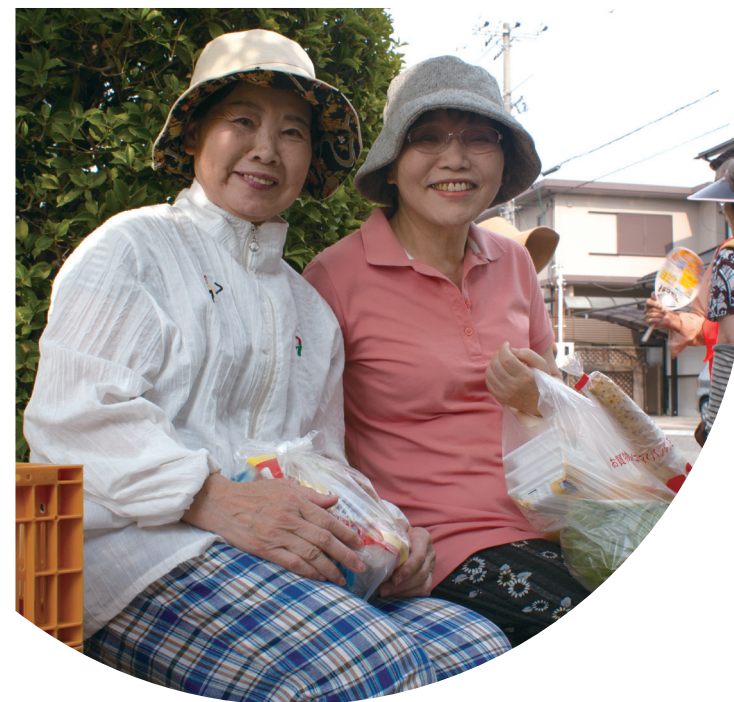
買物を終えると、井戸端会議がスタート。停留所は青空サロン状態。みなさんの笑顔があふれます。