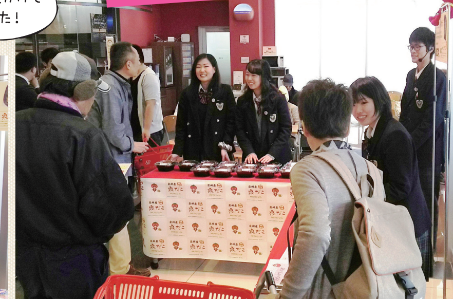
商品開発クラブのメンバーが対面販売。多くの方にお越しいただきました!