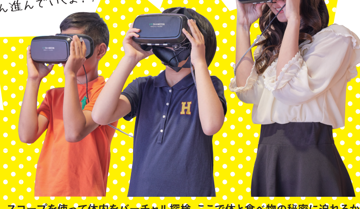
スコップを使って体内をバーチャル探検。ここで体と食べ物の秘密に迫れるかも!?

ゴール! 「たべることのたいせつさ」が何かわかったよ! その秘密は…君もミュージアムで探してみて!