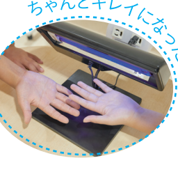
ちゃんとキレイになっただ!