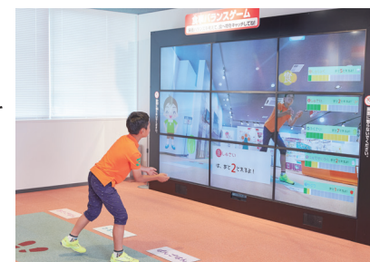
9面の大画面でゲームに挑戦。うまくクリアできるかな?