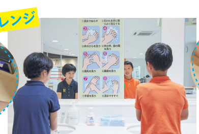
手についた汚れをちゃんと落とせる?