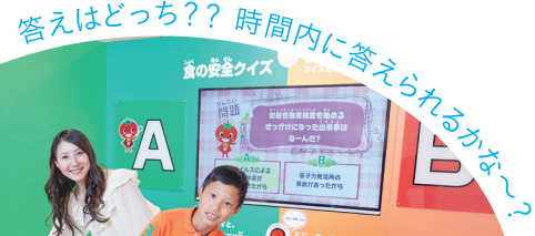
答えはどっち?? 時間内に答えられるかな?~?