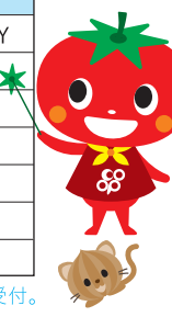
イベントの申込は、ホームページにて7/21より受付。