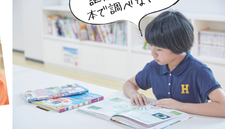
もう少し謎が解けないの、本で調べないの。