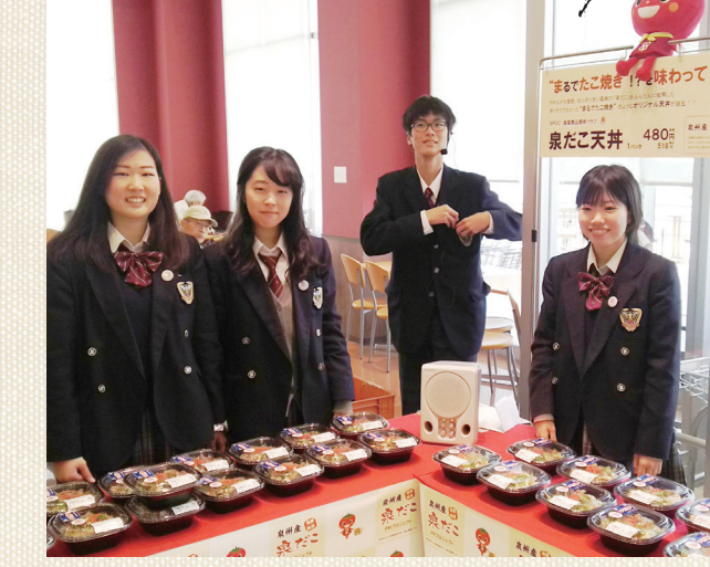
商品開発のプロと会議を重ね、約4か月をかけてようやく販売できました!

4月22日(土)、コープ岸和田において、岸和田市立産業高校の商品開発クラブと生協がコラボした「まるでたこ焼き!! 泉だこ天井」を販売しました。 当日は販売開始とともに、商品の周りには人だかりが! 地元ブランド「泉だこ」を使用したオリジナル天井は、瞬間に完売しました。購入した方からは「まさに、たこ焼きの味だった」「また販売してね!」と、うれしいお声をたくさんいただきました。