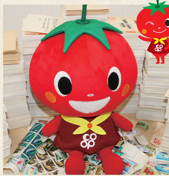
とまとと一緒に参加しませんか?

子ども食堂や学習支援の場づくりなど、地域の子どもの支援にとりくんでいる市町村や団体をサポートするために役立っています。 今年1月~3月にとりくんだ「書き損じはがき募金」には11,614人の組合員から1,650万円相当の寄付が寄せられました。 5月からは、組合員を対象に1口100円から参加できる「サポーター登録」もスタートしました。