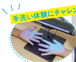
手洗いにチャレンジ