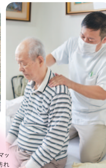
▶週に1~2度、マッサージの先生が訪れて体をほぐしてくれるのだとか。