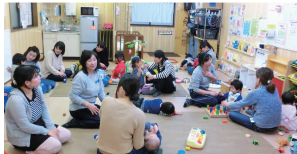
▶隣の人との距離が近く、友だちになるきっかけにも。

5年前の立ち上げ当初から携わっているスタッフは「初めて来てくれた人や顔なじみさんがいない人には、月齢の近い利用者さんを紹介したり、話題を振って話のきっかけを作ったりしています」。また、アドバイスをする際には「うちはこんなやったよ〜」と同じママ目線で接するようにしているのだとか。