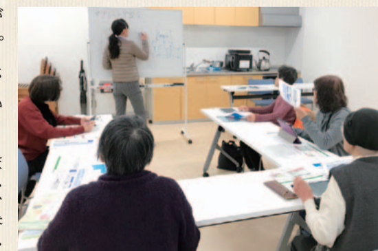
6名前後の少人数制で、1人ひとりに寄り添ったサポートを行っています

「タブレットがあることで、毎日の楽しみが増えれば」という思いから生まれた「コープのタブレット」。調べものはもちろん、お孫さんの写真を見たい、旅行先でマップを使いたい…など、さまざまな希望に応えるため、ご利用者対象の無料学習会を行っています。テキストは生協オリジナルで、「まったく初めてでもちゃんとわかる」がモットー。参加者からは「来て良かった」「わかりやすく助かった」とお声をいただいています。