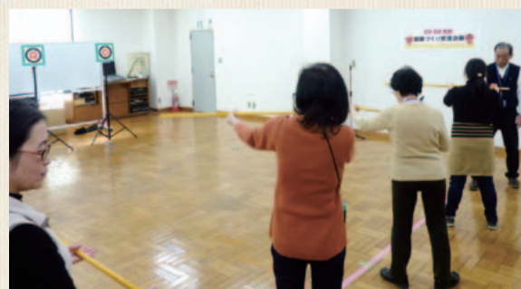
性別・年齢を超えてみんなが夢中に!

1月に健康イベントとして開催した「スポーツ吹矢」は、6~10m先の的に矢を吹き、得点を競う競技。背筋を伸ばし、的を狙うことで集中力が高まるのだとか。また、息を吹き出す際の腹式と胸式を組み合わせ合わせた呼吸法がエクササイズにも。この日は、53名の参加があり、楽しくてヘルシーな新スポーツを通して和気あいあいと楽しむ姿が見られました。