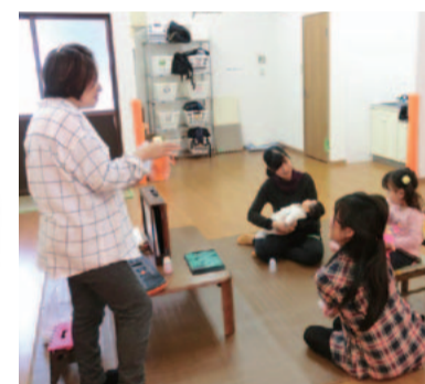
紙芝居のワークショップ中。お話にあわせて手作り楽器で音を出したり、子どもも大人も興味津々！