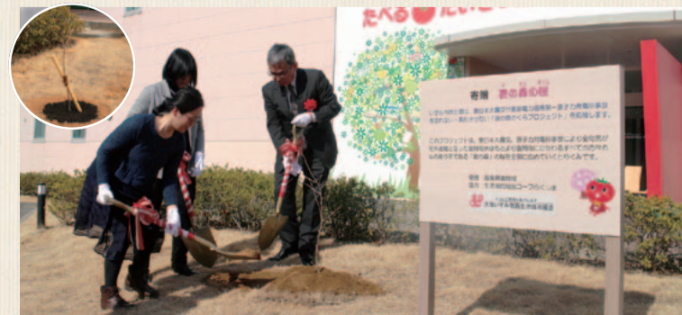
震災の記憶を語り継ぐシンボルとして大切に育てていきます。

東日本大震災、東京電力福島第一原子力発電所事故から7年。被害を受けた福島県富岡町の桜の名所「夜の森」の桜の苗木を全国各地に植樹するとりくみが広がっています。2月「たべる*たいせつミュージアム」敷地内で植樹式を行いました。